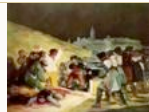
Goya - Tres de Mayo