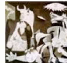
Pablo Picasso - Guernica