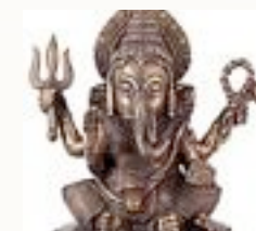
Statue de Ganesh

Une poterie Lapita - Le Manuscrit d'Osiris - Les éléments d'architecture d'un temple grec - Une pièce de monnaie romaine - Un bas relief chrétien - La cathédrale Sainte-Sophie - Une calligraphie de la Chine des Hans - Une statue de Ganesh