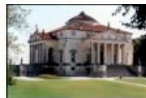
Palladio, La Villa Rotonda