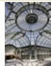
Deglane & alii - Le Grand Palais

Goya, Tres de Mayo - Deglane & alii, Le Grand Palais - David, Le Sacre de Napoléon - Chaplin, Modern Times (extrait) - Polanski, Oliver Twist (extrait) - Millet, Les Glaneuses - Monet, Impression, soleil levant - Une sculpture kanak - Gauguin, Nafae faa ipopo - Picasso, Les Demoiselles d'Avignon