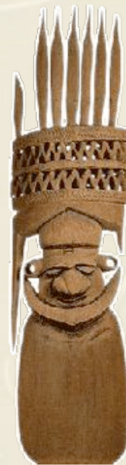
Flèche faïtière kanak de grande maison cérémonielle

Bois de houp, 228 cm, début XVIe siècle, Nord de la Nouvelle-Calédonie Muséum National d'Histoire Naturelle, Paris