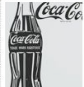
Coca Cola Bottle, A. Warhol,

Chaque élève présente le commentaire d'une oeuvre étudiée cette année.