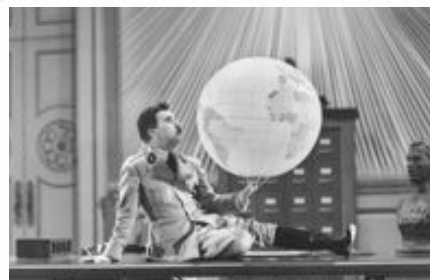
Le Dictateur, Charlie Chaplin, 1940