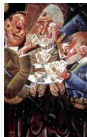
Les joueurs de cartes, Otto Dix, 1920