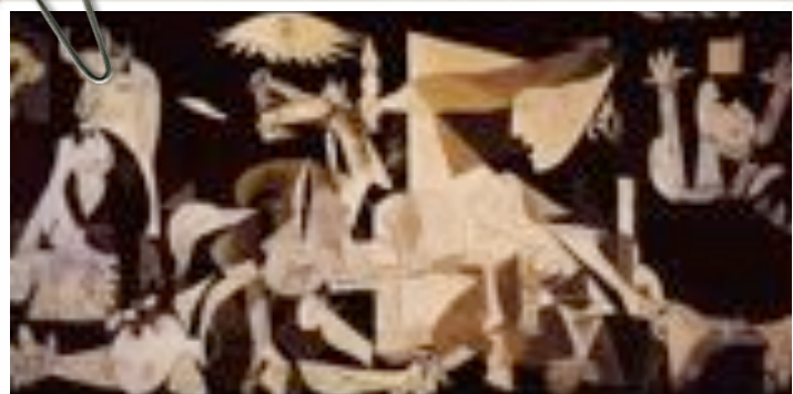
Guernica, Pablo Picasso, 1937