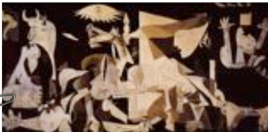
Guernica, Pablo Picasso, 1937