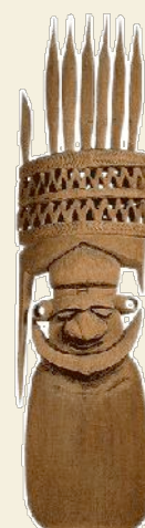
Flèche faitière kanak, début XV e siècle, Nouvelle-Calédonie