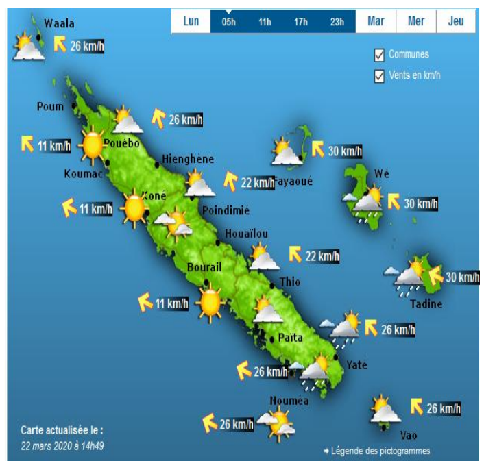
Document 1 : Bulletin de prévisions météorologiques de la commune de Houaïlou du lundi 23 au jeudi 26 mars 2020 (Source: www.meteo.nc )